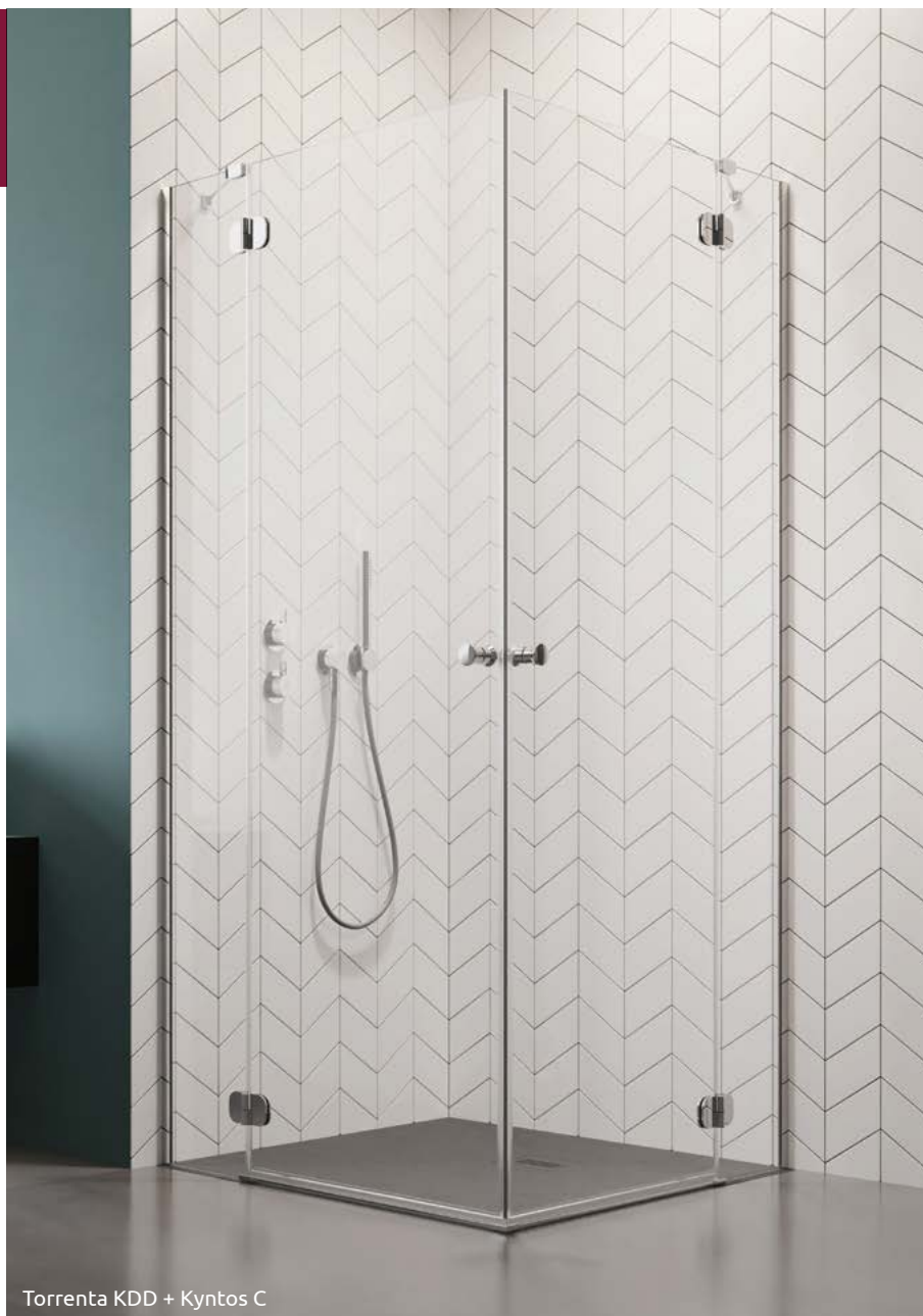
Torrenta KDD + Kyntos C