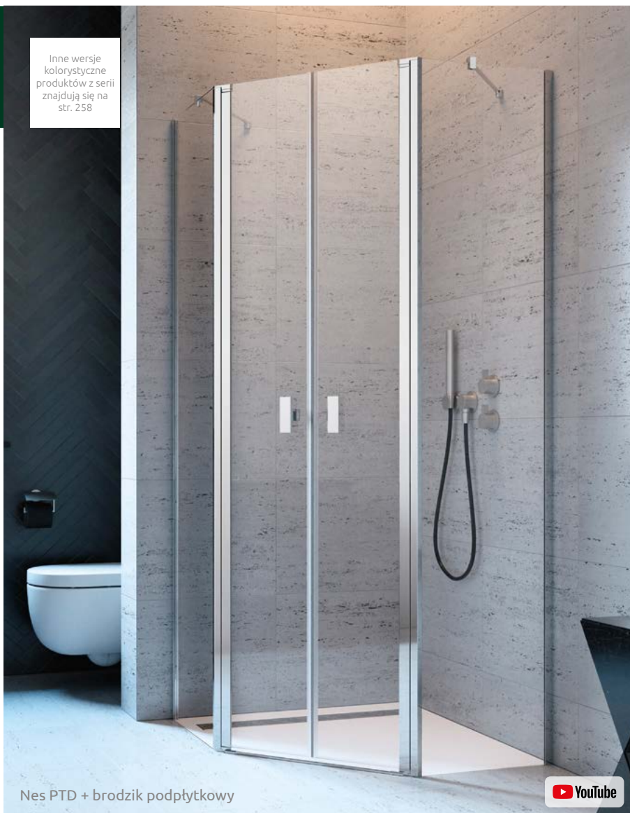
Nes PTD + brodzik podpłytkowy