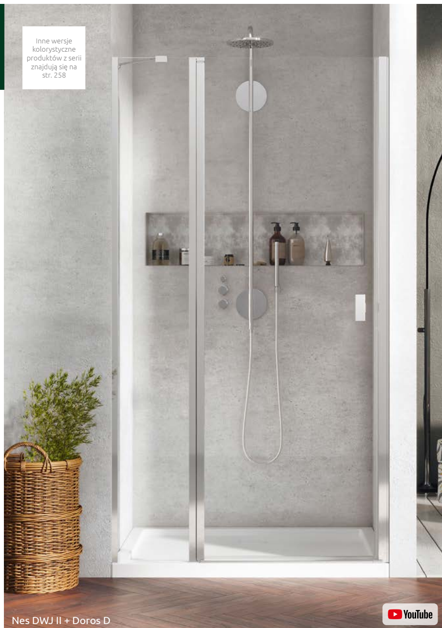
Nes DWJ II + Doros D