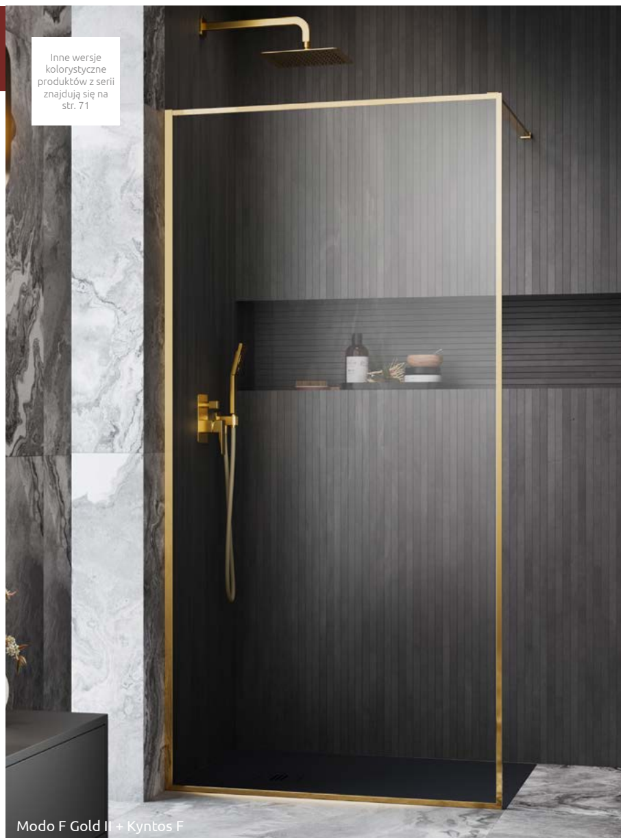
Modo F Gold II + Kyntos F

Kabina jest uniwersalna, można zamontować ją zarówno jako wersję lewą, jak i prawą. W numerze artykułu symbol XX należy zastąpić symbolem wybranego koloru.