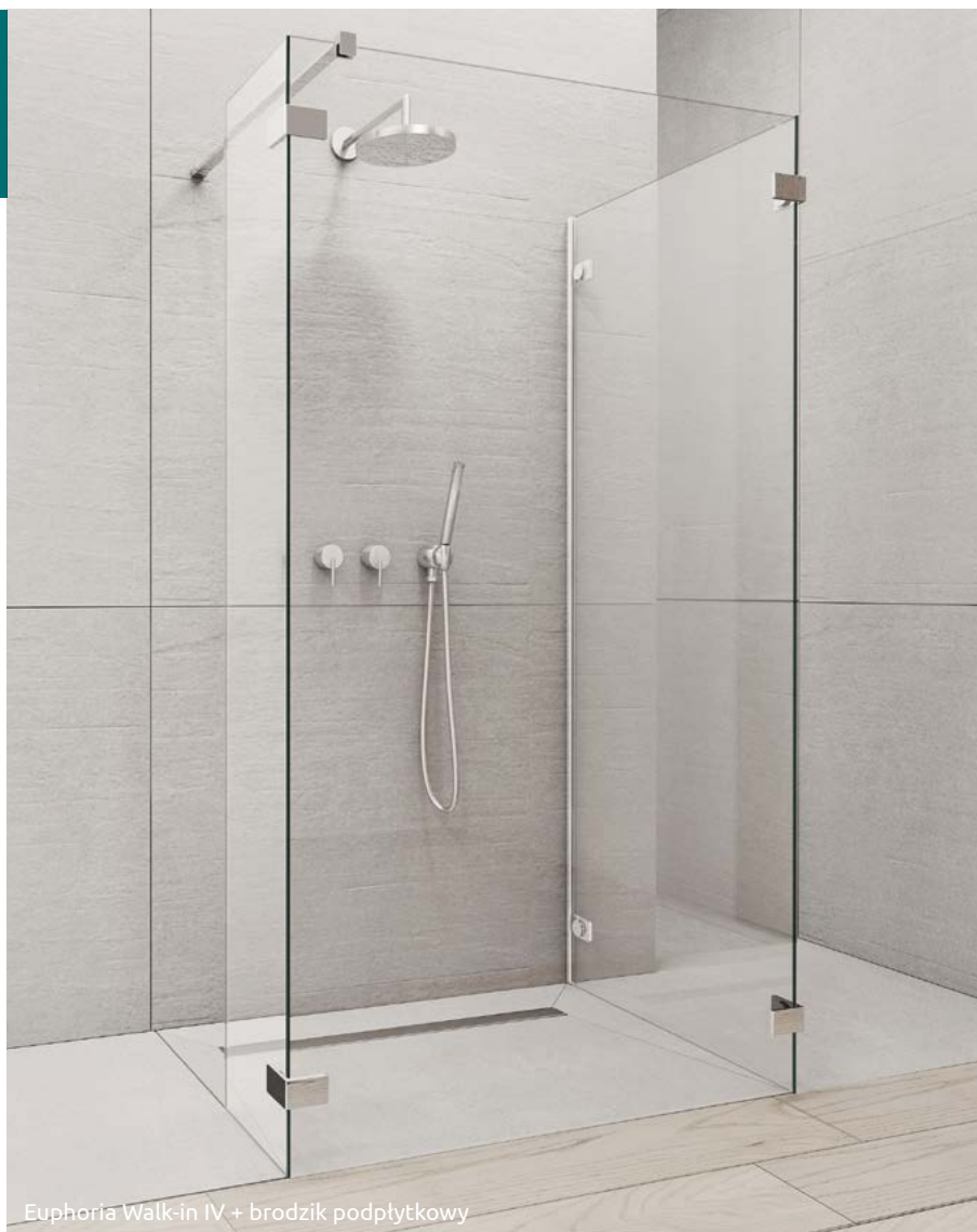
Euphoria Walk-in IV + brodzik pod płytą