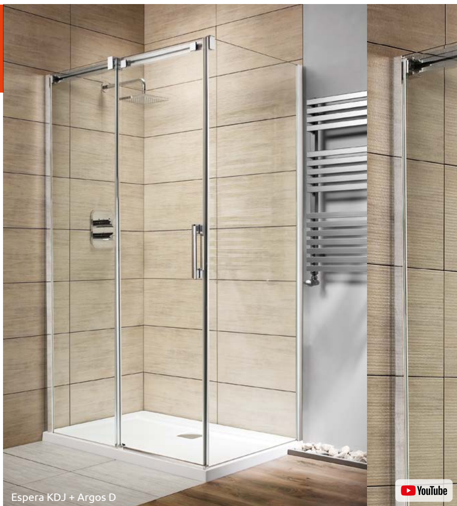
Espera KDJ + Argos D

Składając zamówienie, należy podać 3 numery artykułów: frontu kabiny (dwa elementy) i ścianki bocznej S1.