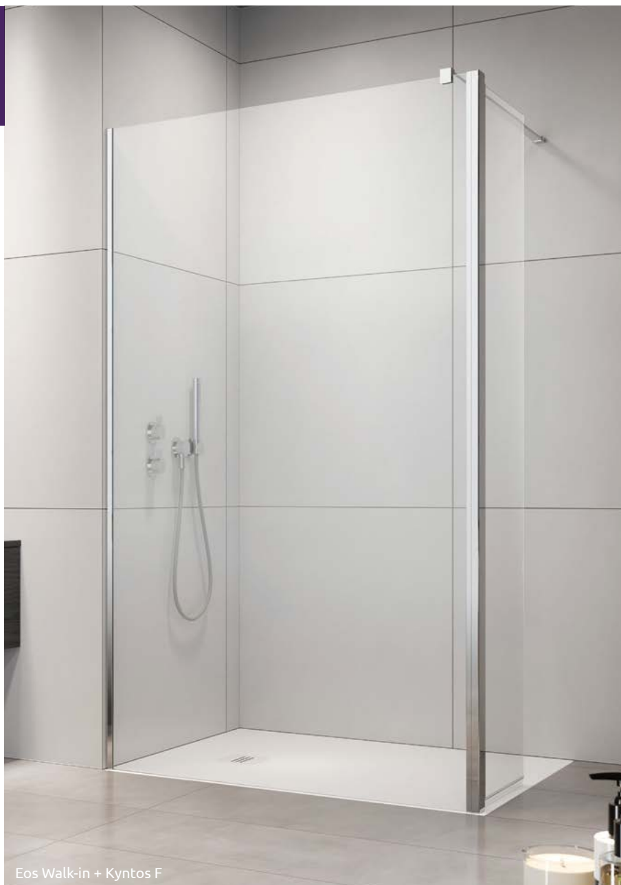
Eos Walk-in + Kyntos F