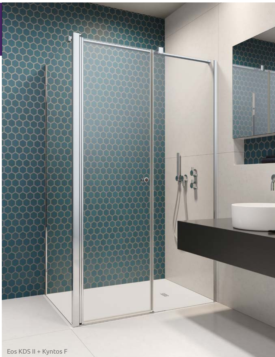
Eos KDS II + Kyntos F