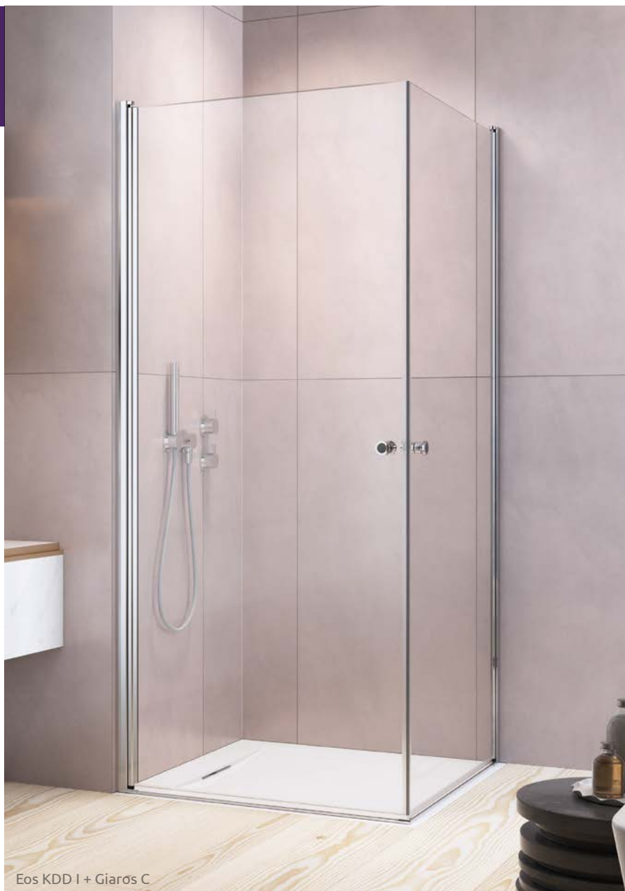
Eos KDD I + Giaros C