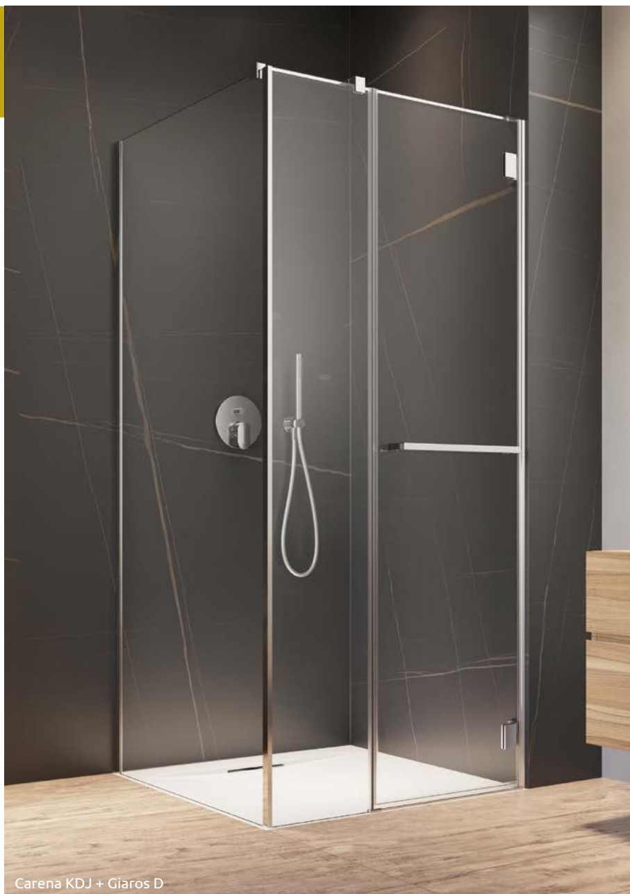
Carena KDJ + Giaros D