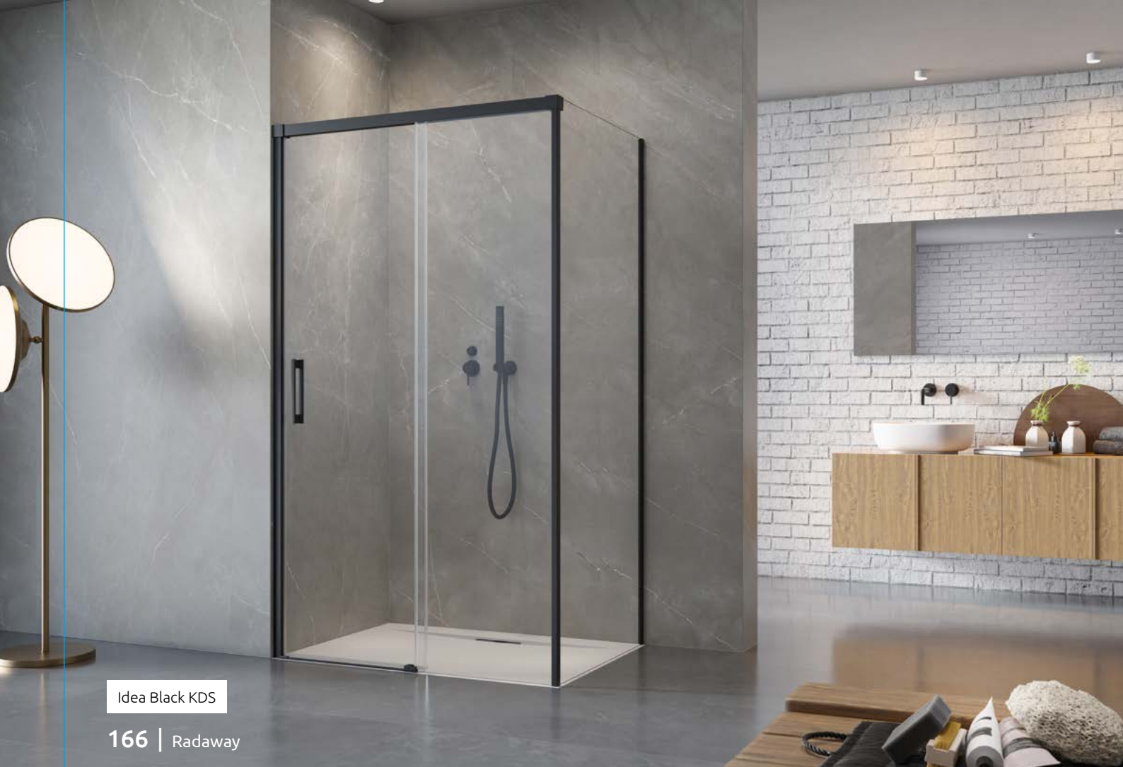
Idea Black KDS