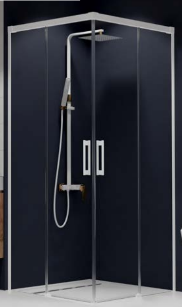
Idea White KDD

* Dettagli del vetro Factory sul nostro sito