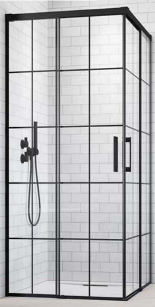
Idea Black KDD Factory

* Dettagli del vetro Factory sul nostro sito