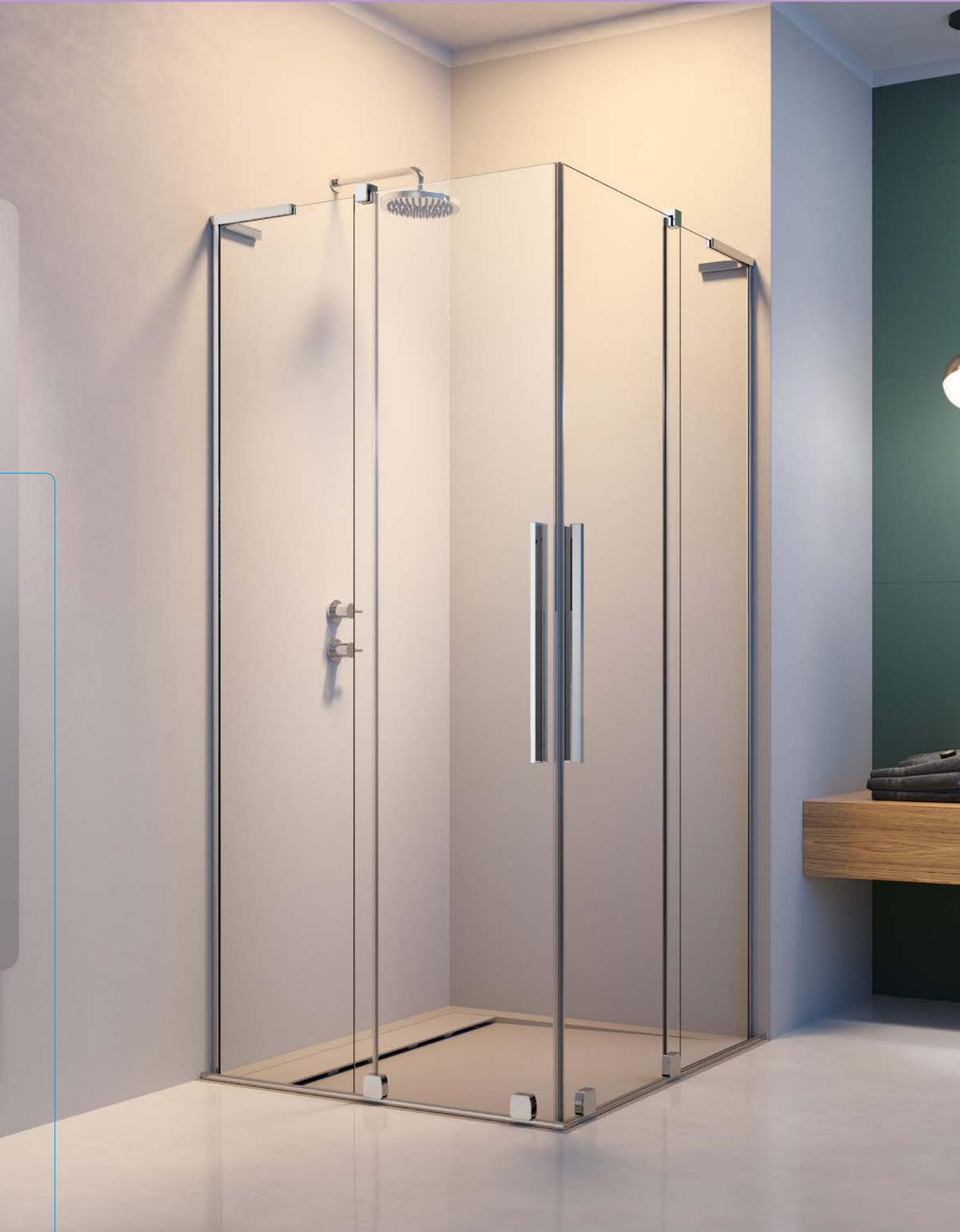
Furo SL KDD