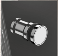
Nes (8) KDD B

Possibilité d'ajouter 1 ou 2 poignée(s) supplémentaire(s). Détails en page 22.