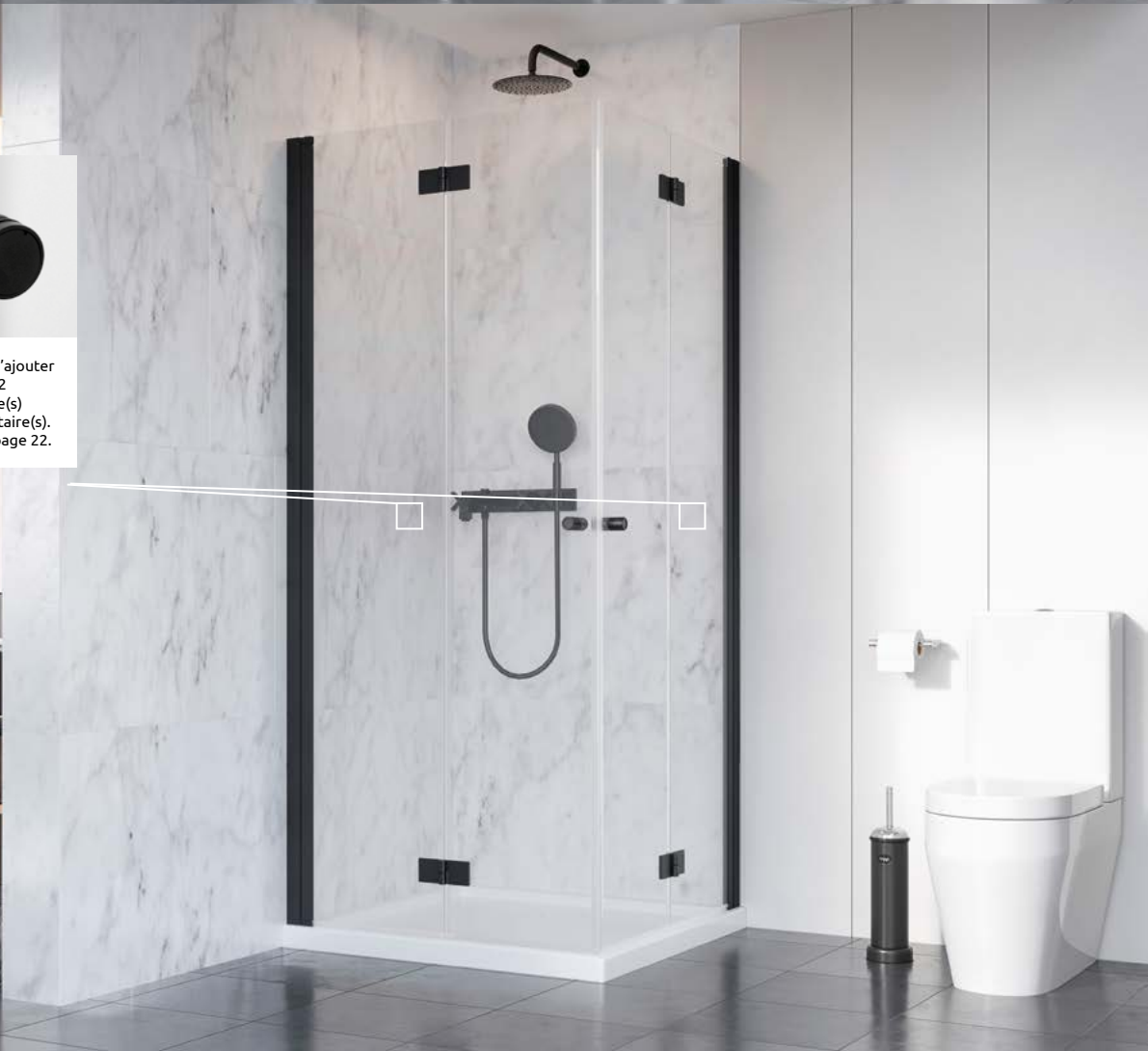
Nes (8) Black KDD B

Possibilité d'ajouter 1 ou 2 poignée(s) supplémentaire(s). Détails en page 22.