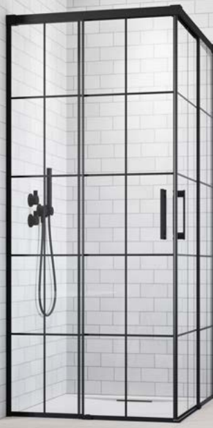
Idea Black KDD Factory

* Détails du verre Factory sur notre site internet